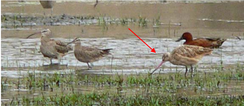
Zarapito moteado ( Limosa fedoa ), 04-Feb-08, estero Mantagua (Reg. V), foto R. Reyes.

Tagua andina ( Fulica ardesiaca ) en el humedal de Carrizal Bajo (Reg. III) (F. Schmitt).