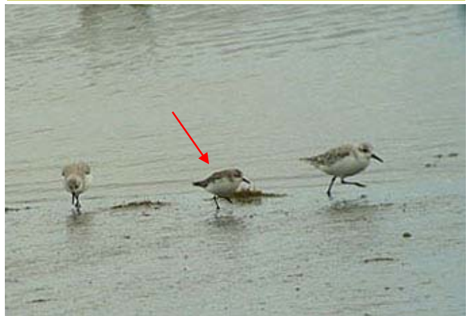
Playero semipalmado ( Calidris pusilla ), 21-Feb-08, Caulín, Chiloé (Reg. X), foto L. Espinosa.