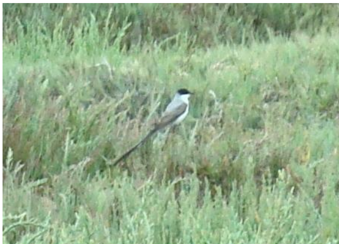
Cazamoscas tijereta ( Tyrannus savana), 02-Dic-07, Carrizal Bajo (Reg. III)