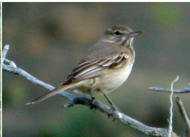
Mero de Tarapacá ( Agriornis microptera ), 28-Dic-07, Torres del Paine (Reg. XII), foto A. Jaramillo.