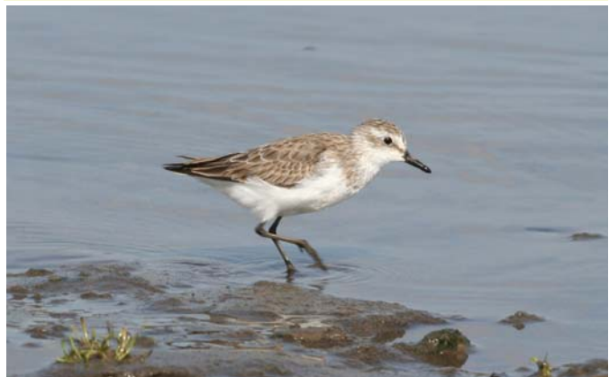
Playero semipalmado ( Calidris pusilla ), 10-Feb-08, desembocadura río Maipo (Reg. V), foto F. Schmitt.