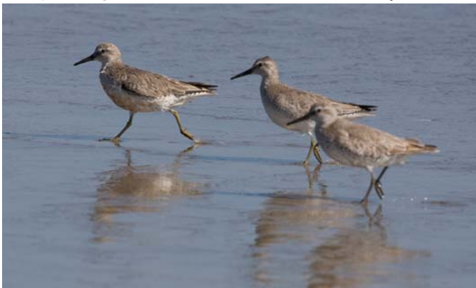
Playero ártico ( Calidris canutus ), 17-Nov-07, playa de Choros (Reg. IV), foto R. Moraga.

3 ej. de Playero ártico ( Calidris canutus ) fueron encontrados en la playa de Choros (Reg. IV) el 17.11 (R. Moraga) y 2 ej. de la misma especie en la punta Espolón de Caulín (Reg. X) el 27.11 (H. Cordero); 1 ej. de Playero de lomo blanco ( Calidris fuscicollis ) en la desembocadura del río Maipo (Reg. V) el 16.12 (F. Schmitt); 1 ej. de Playero pectoral ( Calidris melanotos ) en el estero