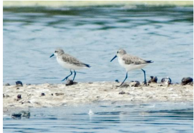
Playero semipalmado ( Calidris pusilla ) y Playero occidental ( Calidris mauri ), 05-Feb-08, laguna Petrel, Pichilemu (Reg. VI), foto F. Díaz.

Para los gaviotines, lo más notable fue un grupo de 960 ej. de Gaviotín sudamericano ( Sterna hirundinacea ) en la laguna Petrel de Pichilemu (Reg. VI) el 05.02 (R. Barros, F. Díaz Segovia); 2 ej. de Gaviotín boreal ( Sterna hirundo ) en la laguna de Cartagena (Reg. V) los días 05 y 16.12 (A. Jaramillo, R. Matus, U. Nancuante), más 8 ej. de la misma especie en la desembocadura del río Maipo (Reg. V) el 05.12 (A. Jaramillo, R. Matus); y 1 ej. de Gaviotín de Sandwich ( Sterna sandvicensis ) en la des-