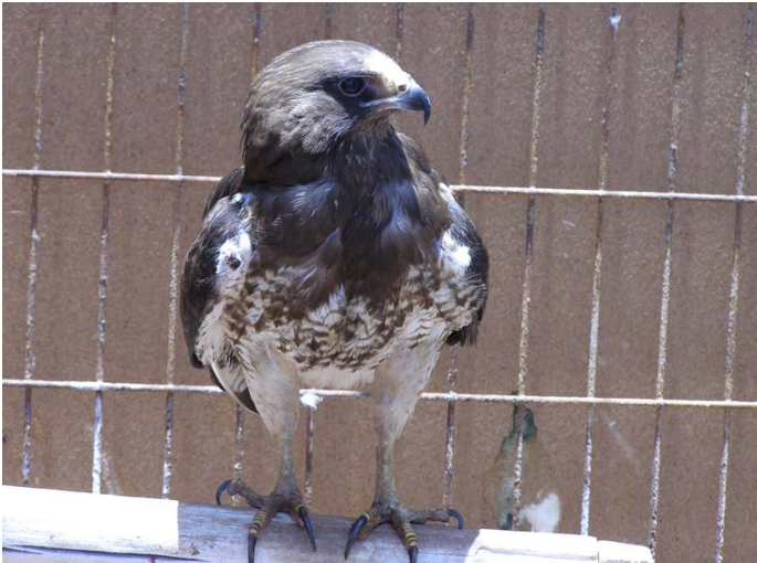
Aguilucho langostero ( Buteo swainsoni ), Nov-07, centro de rescate Antofagasta (Reg. II), foto A. Ugarte.

También se encontró 1 ej. de Flamenco chileno ( Phoenicopterus chilensis ) en la albufera del humedal El Yali (Reg. V) el 04.02, y 2 ej. de la misma especie el 06.02 en la desembocadura del río Mataquito, al sur de Iloca (Reg. VII) (R. Barros, F. Díaz Segovia).