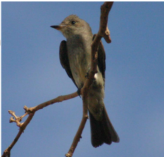
Pibí sp. ( Contopus sp.), Nov-07, María Elena, valle del río Loa (Reg. II)