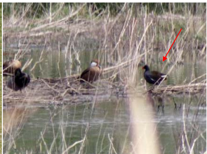
Tagüita del norte ( Gallinula chloropus ), 08-Nov-07, tranque La Cadellada (Reg. Met.), foto P. Acuña.