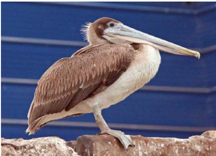
Pelícano pardo ( Pelecanus occidentalis ), 12-Dic-07, puerto de Arica (Reg. XV), foto A. Jaramillo.

También se realizó un censo muy interesante de 55 ej. de Fardela negra ( Puffinus griseus ) por minuto desde la punta Guabún en la Isla de Chiloé (Reg. X) el 28.11 (H. Cordero).