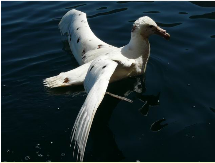
Petrel gigante antártico ( Macronectes giganteus ), 28-Dic-07, Arica (Reg. XV), foto R. Herrera.

Simeone, B. Gates, D. Gushee y B. Field). Además, el 10.02 durante un crucero navegando de norte a sur en la longitud 75°52'W, se observó entre los 45°S y 46°S (Reg. XI), 1 ej. de Albatros de cabeza gris* ( Thalassarche chrysostoma ), 3 ej. de Albatros errante* ( Diomedea exulans ), 1 ej. de Petrel azulado* ( Halobaena caerulea ) y 1 ej. de Fardela blanca de Juan Fernández* ( Pterodroma externa ), seguramente el registro más austral para esta última especie (L. Gardella).