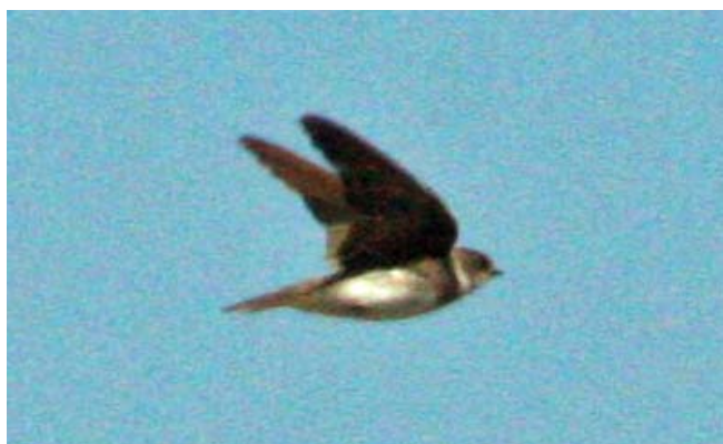
Golondrina barranquera ( Riparia riparia ), 05-Dic-07, Batuco (Reg. Metr.), foto A. Jaramillo.

Pero lo más espectacular de la temporada para el grupo de los passeriformes, es el descubrimiento de dos cazamoscas del género Contopus , un género nuevo para Chile: 1 ej. de Pibí occidental ( Contopus sordidulus ), descubierto en la valle de Chaca (Reg. XV) el 12.12 (A. Jaramillo, R. Matus), que corresponde al primer registro para Chile!!! y 1 ej. de Pibí sp. ( Contopus sp. ), probablemente de la misma especie que el anterior, observado cerca de María Elena en la valle del río Loa (Reg. II) en noviembre (C. González, R. Olivares, A. Ugarte).