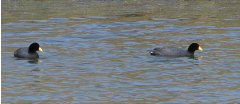
Tagua andina ( Fulica ardesiaca ), 5-Ene-08, Carrizal Bajo (Reg. III), foto F. Schmitt.