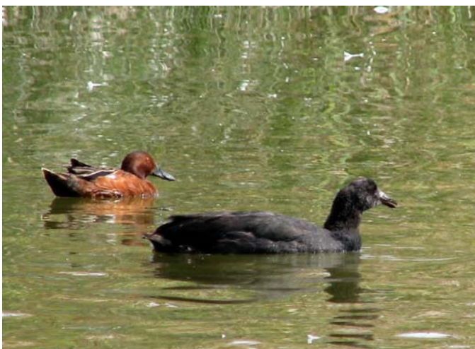
Tagua gigante ( Fulica gigantea ), 15-Dic-07, desembocadura del río Lluta (Reg. XV), foto R. Peredo.

En la desembocadura del río Lluta (Reg. XV), apareció 1 juv. de Tagua gigante ( Fulica gigantea ), nueva especie para este famoso lugar, del 09 al 15.12 (A. Jaramillo, R. Matus, R. Peredo). Dentro de la misma familia, 1 ej. de Tagüita del norte ( Gallinula chloropus ) es registrada a un costado del tranque La Cadellada en Lampa (Reg. Met.) el 08.11 (P. Acuña, V. López, M. Vukasovic), volviendo a observarse el 18.11 (R. Barros, F. Díaz Segovia, I. Azócar); se escucharon 6 ej. de Pidén austral ( Rallus antarcticus ) en el parque Torres del Paine (Reg. XII) el 28.11 (A. Jaramillo, R. Matus), y el 05.01 se contabilizaron 20 ej. de Tagua común ( Fulica armillata ) junto a 4 ej. de