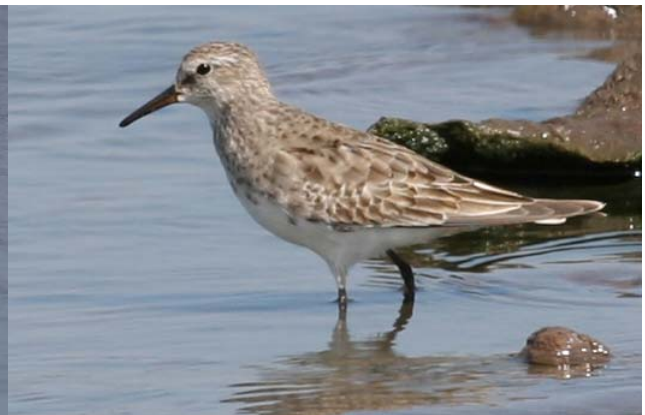
Playero de lomo blanco ( Calidris fuscicollis ), 16-Dic-07, desembocadura río Maipo (Reg. V), foto F. Schmitt.