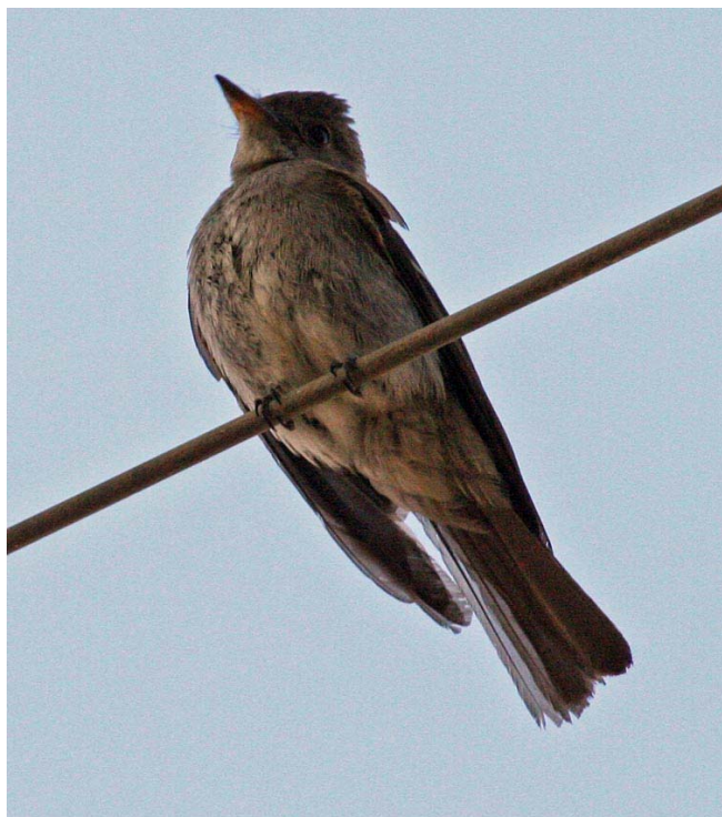
Pibí occidental ( Contopus sordidulus ), 12-Dic-07, valle de Chaca (Reg. XV), foto A. Jaramillo.