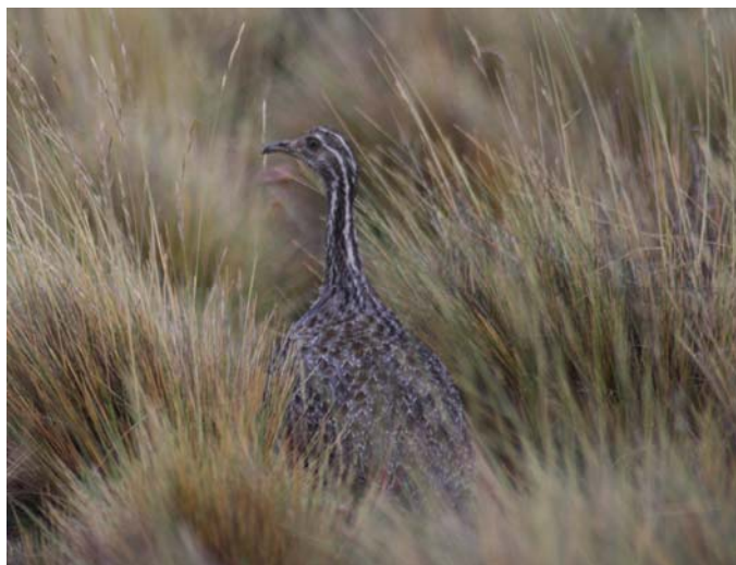
Perdiz austral ( Tiamotis ingoufi ), Dic-07, Bahía Posesión (Reg. XII), foto C. González.

Aunque es poco habitual comenzar esta crónica por una perdiz, esta vez la iniciamos con 3 ej. de Perdiz austral ( Tiamotis ingoufi ) observadas en Bahía Posesión (Reg. XII) en diciembre (C. González), lo que constituye uno de los pocos registros de esta especie en Chile.