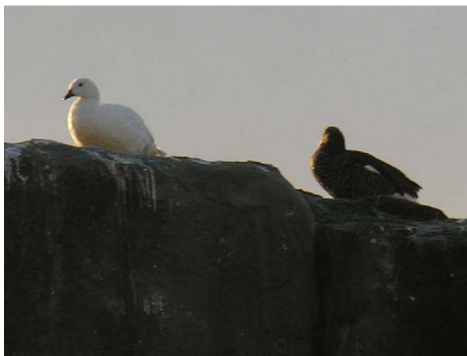
Caranca ( Chloephaga hybrida ), 21-Feb-08, Punta Lavapié, costa de Arauco (Reg. VIII), foto R. Barros.

También se reportó 1 ej. de Cisne de cuello negro en el humedal de Carrizal Bajo (Reg. III) el 05.01 (F. Schmitt); un grupo importante de 243 ej. de Canquén ( Chloephaga poliocephala ) el 15.02 en la laguna Jara cerca de Lonquimay (Reg. IX) (R. Barros); 1 par. con 3 juv. volando de Caiquén ( Chloephaga picta ) cerca del embalse El Yeso (Reg. Met.) el 09.02 (A. Jaramillo, R. Matus); más 8 ej. de esta última especie en el lago Colbún (Reg. VII) el 14.02 (A. Jaramillo, R. Matus). También, al norte de su rango habitual, se descubrieron 2 m. junto a 3 he. de Caranca ( Chloephaga hybrida ) en Punta Lavapié, costa de Arauco (Reg. VIII) el 21.02 (R. Barros).