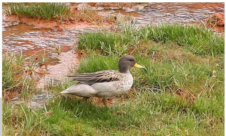
Jergón chico del norte ( Anas flavirostris oxyptera ), 16-Dic-06, Rio Yeso (Reg. Metr.), foto P. Caceres.

Si quieres participar en el foro de Observaciones Chilenas, visita nuestra pagina: