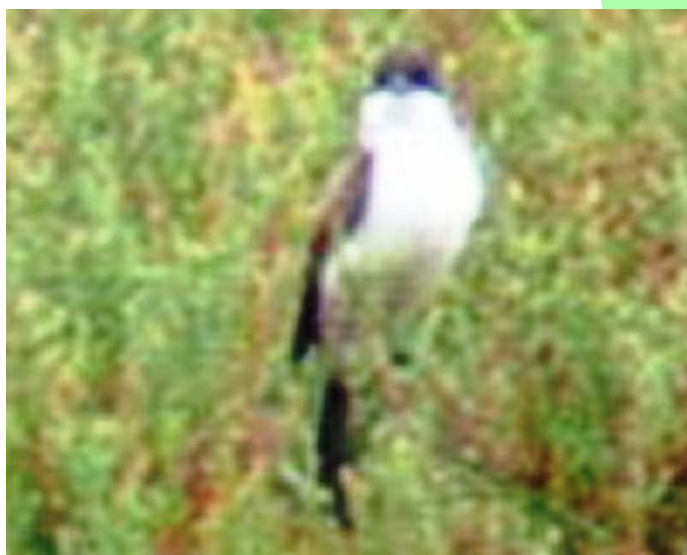
Cazamoscas tijereta ( Tyrannus savana ), 26-Feb-07, humedal costero de Totoral (Reg. III), foto J. L. Brito.