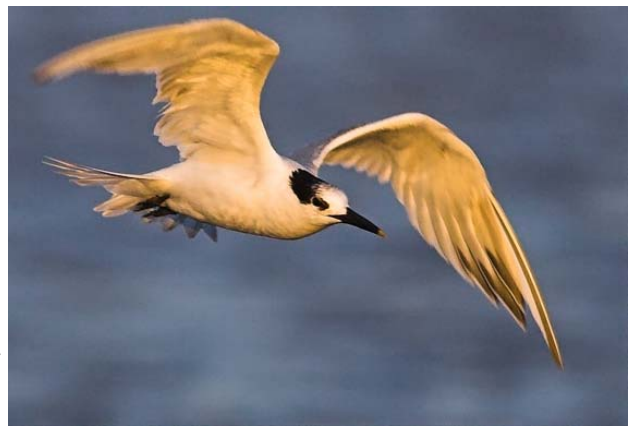
Gaviotín de Sandwich ( Thalasseus sandvicensis ), 27-Nov-06, Desembocadura del Rio Maipo, (Reg. V), foto R. Moraga.