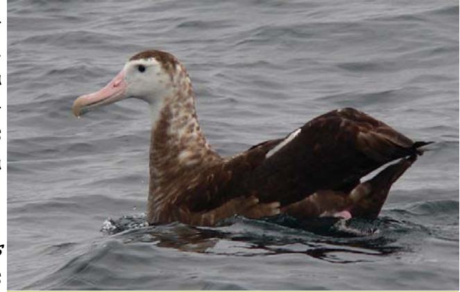
Albatros de las Antípodas ( Diomedea exulans antipodensis ). 23-Nov-06, salida pelagica desde Quintero (Reg. V), foto R. Reyes.

80 ind. de Flamenco chileno ( Phoenicopus chilensis ) son observados el 7.11 en las salinas del humedal El Yali (Reg. V) (J.P. De La Harpe). De igual forma, todos los avistamientos de Flamenco en la costa son muy bienvenidos!