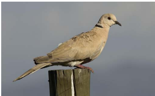
Tórtola de collar ( Streptopelia 'risoria' ), 9-Dic-06, Lampa (Reg. Metr.), foto J.P. De La Harpe.