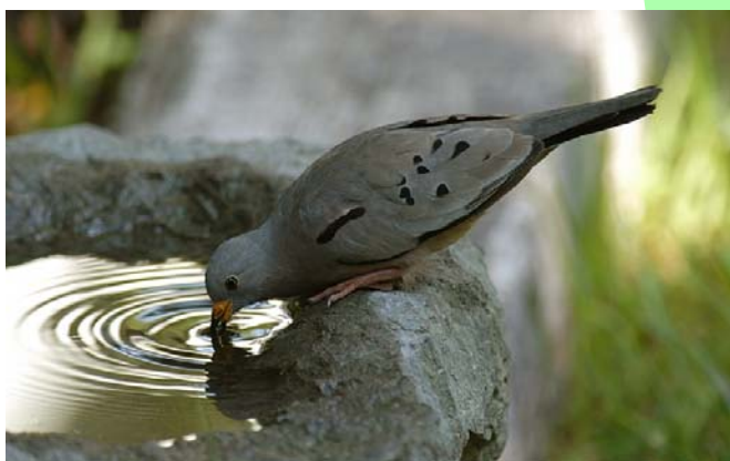
Tortolita quiguagua ( Columbina cruziana ), 18-Feb-07, Copiapó (Reg. III)