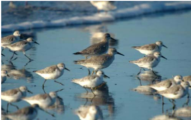
Playero ártico ( Calidris canutus ), 9-Dic-06, desembocadura del río Maipo, (Reg. V), foto R. Demangel.

bandada de unos 200 playero ártico ( Calidris canutus ), Tierra del Fuego (Reg. XII) (RM); 2 ind. de Playero ártico ( Calidris canutus ) el 9.12 en la desembocadura del río Maipo (Reg. V) (RD) y una estimación de 9000 ind. de esta misma especie en su lugar habitual de invernada en Bahía Lomas (Reg. XII) el 30.01 (RM); 3000 ind. de