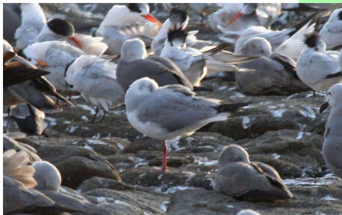
Gaviota de capucho gris ( Larus cirrocephalus ), 20-Nov-06, desembocadura del río Lluta (Reg. I), foto A. Jaramillo.