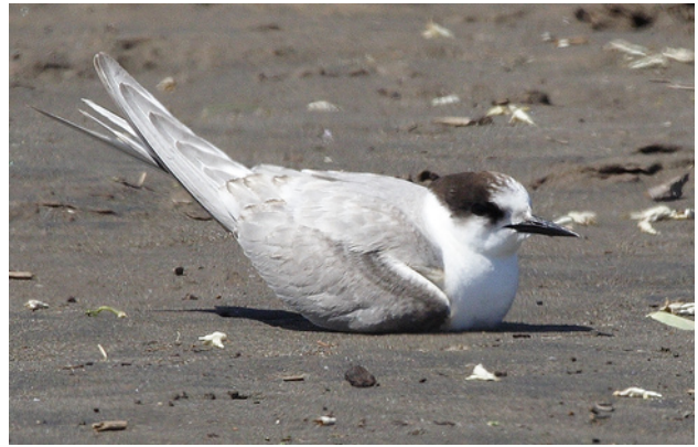
Gaviotín ártico ( Sterna paradisaea ), 19-Nov-06, Desembocadura del Rio Maipo, (Reg. V), foto P. Caceres.

1 ind. de Vencejo de chimenea ( Chaetura pelágica ) es observado desde el aeropuerto de Arica (Reg. I) el 18.11 (AJ); y 1 ind. de Picaflor de Cora* ( Thaumastura cora ) en Cuya (Reg. I) - actualmente el avistamiento más al sur para esta especie - el 7.01 (B. Knapton).