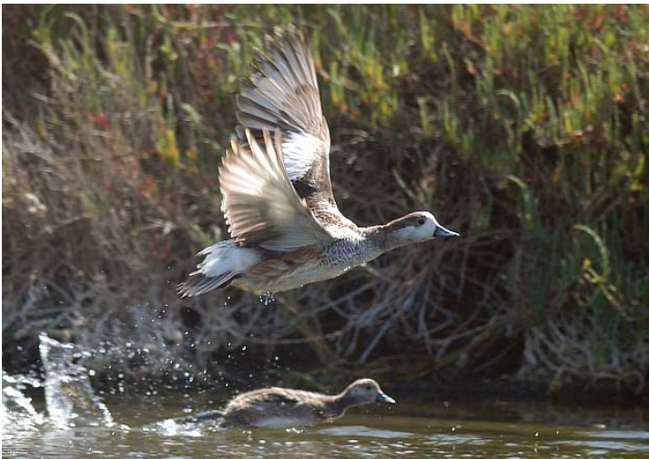
Pato Real ( Anas silibatrix ), 26-Nov-06, Tongoy (Reg. IV), foto E. Artigeau.

Los avistamientos raros para los cuales no recibimos "prueba" (foto o grabacion de sonido por ejemplo) se señalan con un *.