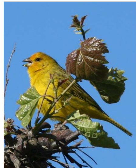
Chirihue azafrán ( Sicalis flaveola ), 4-Dic-06, Maullín (Reg. X), foto F. Schmitt.

1 ind. de Zorzal argentino* ( Turdus amaurochalinus ) el 20.11 en Putre (Reg. I) (AJ); 1 ind. cant. de Bailarín chico argentino ( Anthus hellmayri ) en el lugar habitual de Victoria (Reg. IX) el 11.11 (AJ); varios avistamientos de Chirihue azafrán ( Sicalis flaveola ) en Pucón (Reg. IX) donde la cantidad registrada mas importante es de 8 ind. el 18.02 (R. Cañete), y una par. es avistada en el pueblo de Maullín (Reg. X) el 4.12 (FS); el m. inm. de Candelita americana ( Setophaga ruticilla ) encontrado en octubre (ver La Chiricoca Nº 2) en Putre (Reg. I) es nuevamente observado el 20.11 (AJ); y finalmente dos avistamientos de Jilguero grande ( Carduelis crassirostris ), ambos en la Reg. Metr., con 2 ind. el 16.11 en Baños Morales (AJ) y 1 ind. el 16.12 cerca del embalse El Yeso (M. López).