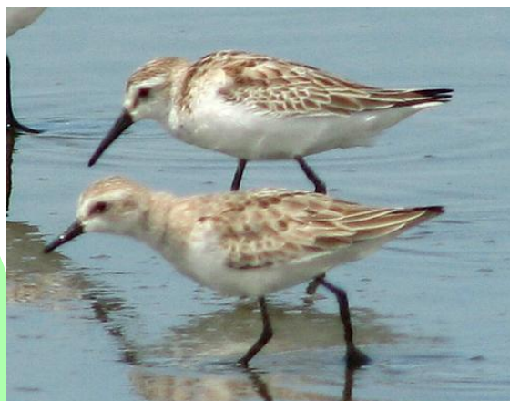
Playero occidental ( Calidris mauri ) y semipalmado ( Calidris pusilla ), 10-Nov-06, Desembocadura Rio Lluta (Reg I), foto R. Peredo.