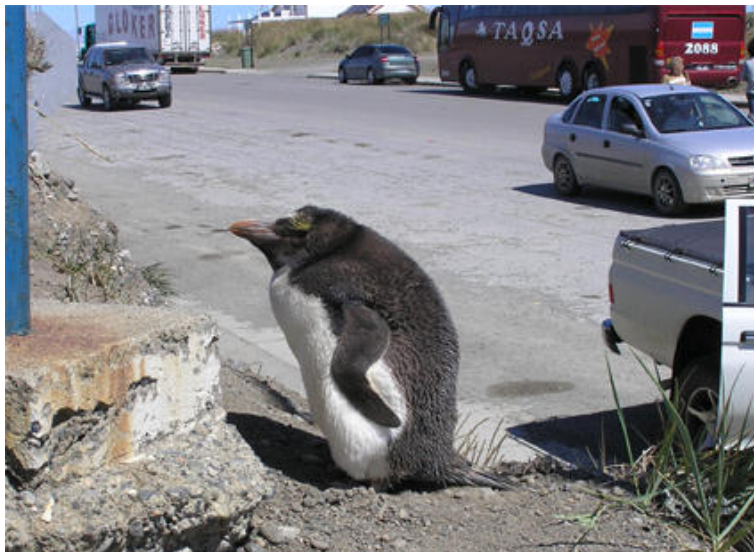
Pinguino macaroni ( Eudyptes chrysolophus ), 29-Ene-2007, Bahía azul (Reg. XII), foto R. Matus.

Algunas observaciones de pingüinos raros durante esta temporada, con 1 ind. de Pinguino rey ( Aptenodytes patagonicus ) encontrado en la colonia de Seno Otway, cerca de Punta Arenas (Reg. XII) el 8.11 (G. Wallace); 1 ind. juv. de Pinguino de penacho amarillo ( Eudyptes chrysocome ) es capturado el 21.02 en la playa de Santo Domingo (Reg. V) (JLB; ver artículo en este número de La Chiricoca), y 1 ind. de Pinguino macaroni ( Eudyptes chrysolophus ) es encontrado el 29.01 en Bahía Azul, Tierra del Fuego (Reg. XII), y que se quedó algunos días en este lugar antes de ser trasladado a un sitio menos visitado por turistas, quienes lo molestaron bastante (RM).