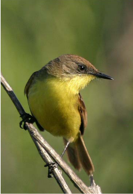
Pájaro amarillo ( Pseudocolopteryx flaviventris ), 25-Nov-06, Lampa (Reg. Metr.).

comuna de Lampa (Reg. Metr.) (RB, FD, RG, M. Marín) donde 5 ind. son contactados el 25.11 (IA, RB); cuatro avistamientos de 1 ind. de Colegial del norte* ( Lessonia oreas ) - siempre el mismo? - entre el 30.10 y el 22.11 en la desembocadura del río Lluta (Reg. I) (AJ, B. Knapton), y 1 macho* el 1.02 en El Molle, valle del Elqui (Región IV) (LB); una increíble serie de avistamientos de Cazamoscas tijereta ( Tyrannus savana ), con 1 ind.* los días 18 y 19.11 en la desembocadura del río Lluta (Reg. I) (P. Burke, G. González), 1 ind.* el 30.12 cerca de la laguna Matanza en el humedal El Yali (Reg. V) (M.P. Lisboa), y 1 ind. el 26.02 en un humedal costero de Totoral (Reg. III) (JLB).