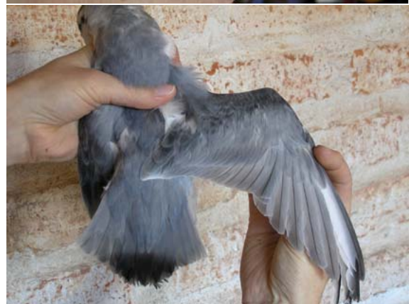
Petrel-paloma de pico delgado ( Pachyptila belcheri ), 26-Feb-07, Punta Arenas (Reg. XII), 26-Feb-07, foto R. Matus.