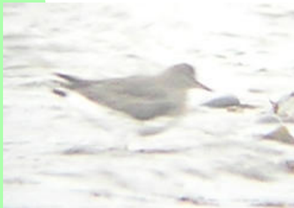
Playero de las rompientes ( Aphriza virgata ), 30-Ene-07, Punta Espora (Reg. XII), foto R. Matus.