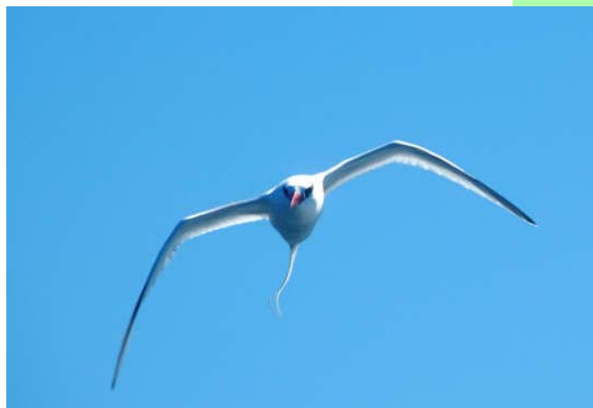
Ave del trópico de pico rojo ( Phaethon aethereus ), 02-Dic-06, Valparaíso (Reg. V), foto R. Gonzalez.