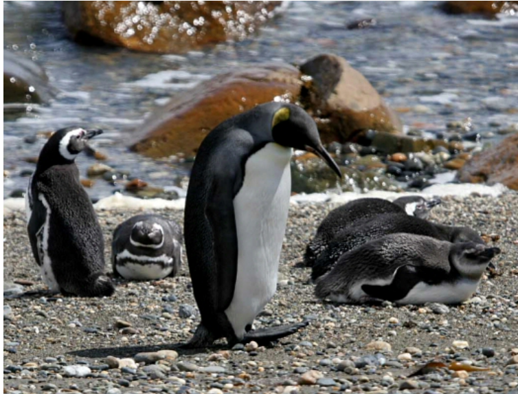
Pinguino rey ( Aptenodytes patagonicus ), 8-Nov-06, Punta Arenas (Reg. XII), foto G. Wallace.

Algunas observaciones de pingüinos raros durante esta temporada, con 1 ind. de Pinguino rey ( Aptenodytes patagonicus ) encontrado en la colonia de Seno Otway, cerca de Punta Arenas (Reg. XII) el 8.11 (G. Wallace); 1 ind. juv. de Pinguino de penacho amarillo ( Eudyptes chrysocome ) es capturado el 21.02 en la playa de Santo Domingo (Reg. V) (JLB; ver artículo en este número de La Chiricoca), y 1 ind. de Pinguino macaroni ( Eudyptes chrysolophus ) es encontrado el 29.01 en Bahía Azul, Tierra del Fuego (Reg. XII), y que se quedó algunos días en este lugar antes de ser trasladado a un sitio menos visitado por turistas, quienes lo molestaron bastante (RM).