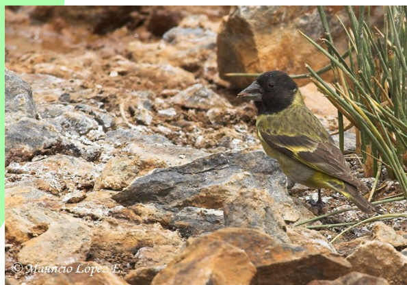
Jilguero grande ( Carduelis crassirostris ), 16-Dic-06, Embalse El Yeso (Reg. Metr.), foto M. López.