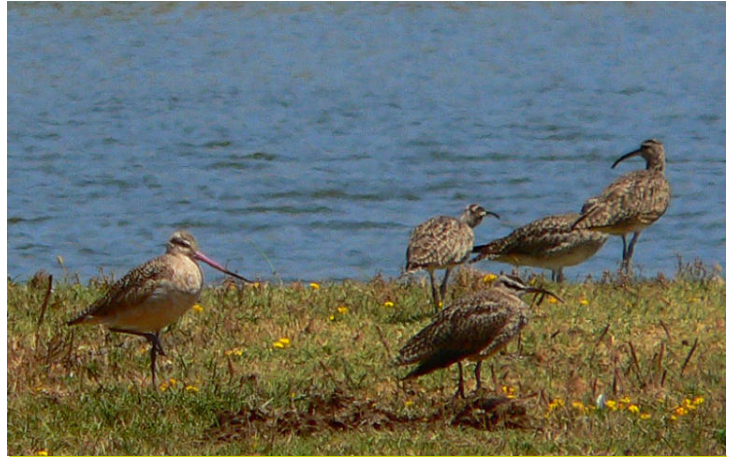
Zarapito moteado ( Limosa fedoa ), 14-Ene-2007, Mantagua (Reg. V), foto R. Reyes.

(Reg. IV) (RC); 1 ind. de Chorlo semipalmado ( Charadrius semipalmatus ) el 14.11 en la desembocadura del río Maipo (Reg. V) (AJ); 6 ind. de Pilpilén* ( Haematopus palliatus ) - especie escasa en Magallanes - el 2.01 en Punta Delgada, primera Angostura (Reg. XII) (RM); 1 ind. de Zarapito moteado ( Limosa fedoa ) - el mismo que los años anteriores? - el 14.1 en el estero Mantagua (Reg. V) (HC, RRe); 2 ind. de Playero grande ( Tringa semipalmata ) el 14.11 en la desembocadura del río Maipo (Reg. V) (AJ); 1 ind. de Playero de las rompientes ( Aphriza virgata ) el 30.01 en Punta Espora junto a una