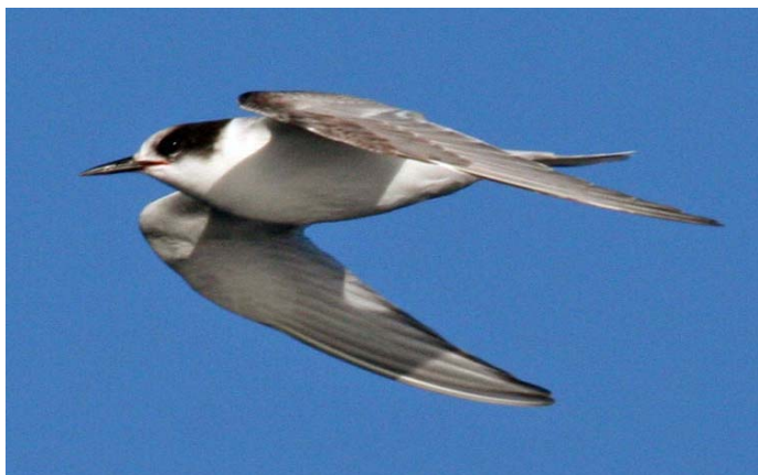
Gaviotín ártico ( Sterna paradisaea ), 15-Nov-06, Salida pelagica desde Valparaiso (Reg. V), foto A. Jaramillo.