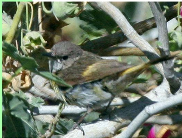
Candelita americana ( Setophaga ruticilla ), 20-Nov-06, Putre (Reg. I), foto A. Jaramillo.