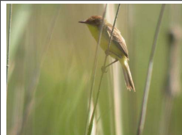
Pájaro amarillo, tranque San Rafael 19 de diciembre 05

Para el grupo de los paserines, 2 ind. de Minero grande están construyendo un nido en Portillo (V) (BB), 1 par. de Patagón en Buque Quemado (XII) el 14.11 (AJ), 1 Chiricoca nidificando en el valle del Yeso (RM) el 25.10 (BB) y un nido con pol. en el mismo lugar el 24.12 (FS), 1 ind. de Canastero de cola larga el 26.10 en el valle del Yeso (RM) (BB), y el primer avistamiento de Fío-fío del verano ocurre el 07.9 en el cerro los Piques, Las Condes (RM) (BR, RR).