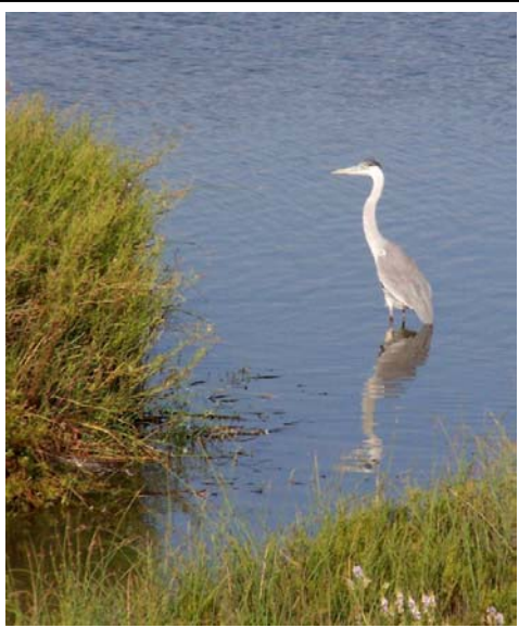
Garza cuca, Laguna de Cartagena (A. Canepa)

Laguna de Cartagena: a pesar de ser comparativamente menor en tamaño, respecto de la Laguna el Peral, la laguna de Cartagena presenta una alta riqueza de especies, pudiéndose observar más de 40 especies de aves. Entre éstas destacan muchas aves migratorias, como Gaviotines, Gaviotas de Franklin, Playeros de Baird, Zarapitos entre otras. También es posible observar aves características como los Perritos, Huairavos, Patos colorados, Patos cucharas, ambas especies de Pato jergón, Cisnes coscorobas (en algunas épocas del año, principalmente primavera), Patos ranas. En esta laguna está registrada la presencia en gran parte del año de la Garza cuca, además de la Garza chica, Garza grande y del Huairavo. Entre los zambullidores se pueden observar al Picurio, Blanquillo, Pimpollo y a diferencia de la laguna el Peral no hay registros constantes de Huala. En esta laguna también existe una colonia