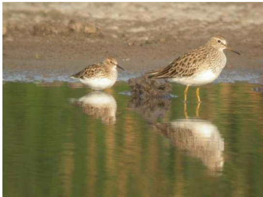
Playero enano y pectoral, laguna Batuco 26 de febrero 06

2 ind. de Salteador chico son observados desde la costa el 18.2 en la desembocadura del Maipo (V) (FS). 1 Gaviota de capucho gris es encontrada en la desembocadura del río Lluta (I) en noviembre (AJ), 1 ad. de Gaviotín apizarrada es descubierto durante un viaje pelágico desde la isla Robinson Crusoe en noviembre (AJ), 4 Gaviotín chico durante un viaje pelágico desde Arica (I) en noviembre (AJ), 1 ad. y 1 inm. de Gaviotín