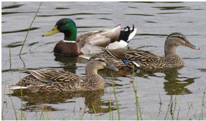
Pato de collar, laguna de Zapallar 01 de octubre

En el norte de su rango, se anota la nidificación del Pato real con 1 par. en el Estero Yali (V)