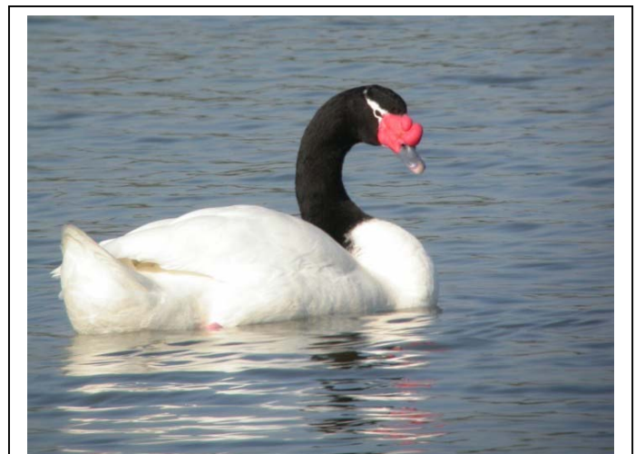
Cisne de cuello negro, Laguna El Peral (F. Schmitt)

Laguna el Peral: esta laguna, con un área aproximadamente de 6 hectáreas, permite la observación de una gran diversidad de aves. Las más representativas del sector son el Cisne de cuello negro, varias especies de patos (Pato rana, Jergón grande, Pato rinconero, entre otros), algunos zambullidores como Pimpollo y Huala. Se encuentran además las taguas, pidenes y tagüitas. Existe además una gran colonia de nidificación de Garza boyera, pudiéndose observar además la Garza chica, Garza grande y el Huairavo. En los ambientes propios de los totorales se pueden observar al Siete colores, Trabajador, Trile y el raro Huairavillo ! Además de éstas aves se pueden observar mamíferos como los coipos que viven en esta laguna.