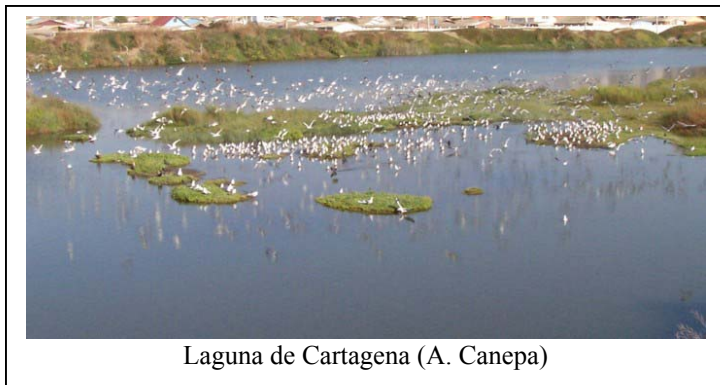
Laguna de Cartagena (A. Canepa)

Esteros San Sebastián: inmediatamente al norte de la Laguna Cartagena. Lugar sin protección activa, por lo tanto sin horario de atención.