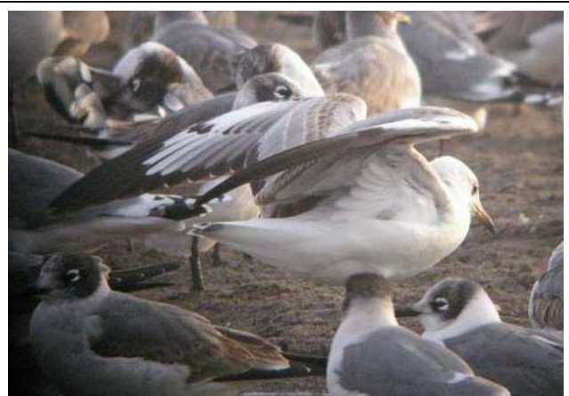
Gaviota de capucho gris, desembocadura del río Lluta noviembre 2005 (A. Jaramillo)

Para las otras especies mas comunes, se registran los primeros Pitotoy chico de la temporada, un grupo de 11 y un otro de 5, el 10.9 en la laguna Batuco (RM) (RB), 1500-2000 ind. de Playero blanco en la Bahía de Caulín (X) el 15.1 (FS), 3 ind. de Playero ártico el 20.2 en la Bahía de Caulín (X) (HC), hasta 35 Pollito de mar tricolor en la laguna de Batuco (RM) (RB, FS), 1 Becacina pintada en Lampa (RM) el 15.10 (RB, HG, BR, RR, PR, FS), y 2000-3000 Zarapito de pico recto el 20.2 en la Bahía de Caulín (X) (HC).