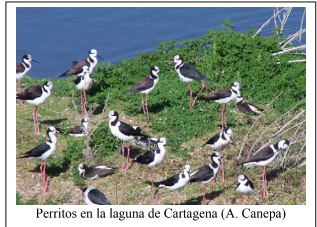
Perritos en la laguna de Cartagena

Estero san Sebastián: las aves que se encuentran en este estero, son similares a las anteriores. Sin embargo en el sector de la desembocadura pueden observarse mayor cantidad de aves playeras, como Chorlo de collar, Chorlo de doble collar, Chorlo chileno, y algunos migradores importantes como son los pitotoyes tanto chicos como grandes, además de algunos playeros como Playero blanco y de Baird.