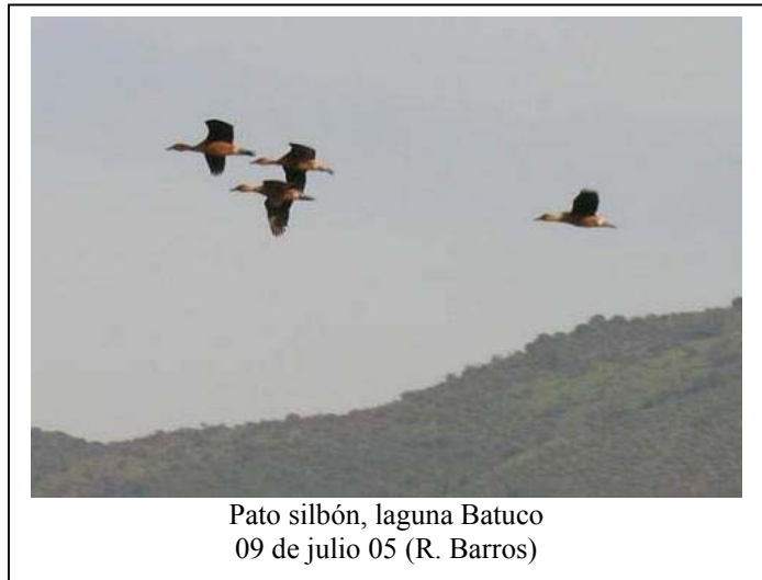
Pato silbón, laguna Batuco 09 de julio 05

Coscoroba : 1 ind. del 23.10 al 06.11 (al menos) en el tranque Larraín, Lo Barnechea (RM) (BR, RR), 2 ind. en la laguna de Cartagena (V) (HC) y 7 individuos el 26.2 en la laguna Batuco (RM) (RB, FS). Avistamiento en baja altitud en verano de Piuquén en la laguna Batuco (RM) con 2 ind. el 05.11 (AJ) y 3 ind. el 19.12 (RB, FS). Un grupo de 106 Caiquén con varias crías y al menos 30 juv. es encontrado a