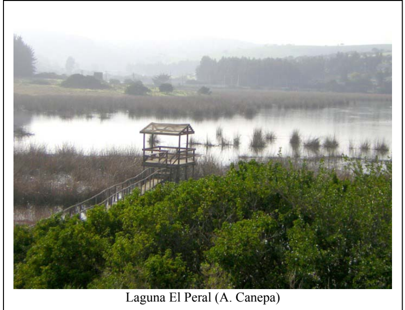
Laguna El Peral (A. Canepa)

Laguna el Peral: Reserva Natural, bajo protección de CONAF. Entrada liberada. El horario de Atención es de 09:00 hrs. hasta las 13:00 hrs. y en la tarde desde las 14:30 hasta las 18:00 hrs.