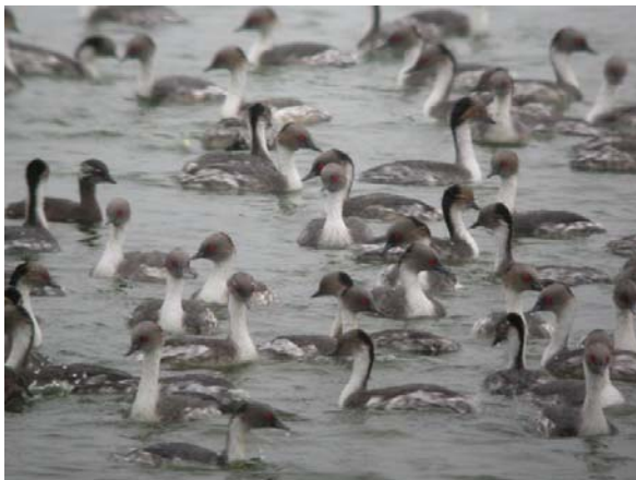
concentración de Blanquillo en el tranque San Rafael, Batuco (F. Schmitt)

Varios ind. de Pato capuchino son observados el 14.11 en Buque Quemado (XII) y al norte de su rango, 2 ind. están presentes el 08.1 en el tranque San Rafael en Batuco (RM) (FS y otros) y 1 ind. es encontrado en la laguna Batuco (RM) los días 19.12 y 26.2 (RB, FS). Hasta 75 Pato rinconero están presentes en el tranque San Rafael en Batuco (RM) el 19.12 (RB, FS), y el 26.2 RB con FS contabilizan 99 individuos de esta especie en este tranque y en la laguna de Batuco (RM).