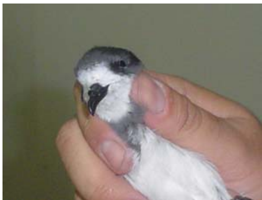
Golondrina de mar de collar, lugar ? fecha ? autor ?...

Lejos de la costa, al interior, una Golondrina de mar de collar es capturada por un veterinario de Iquique, pero sin lugar y fecha precisa (info. HG).