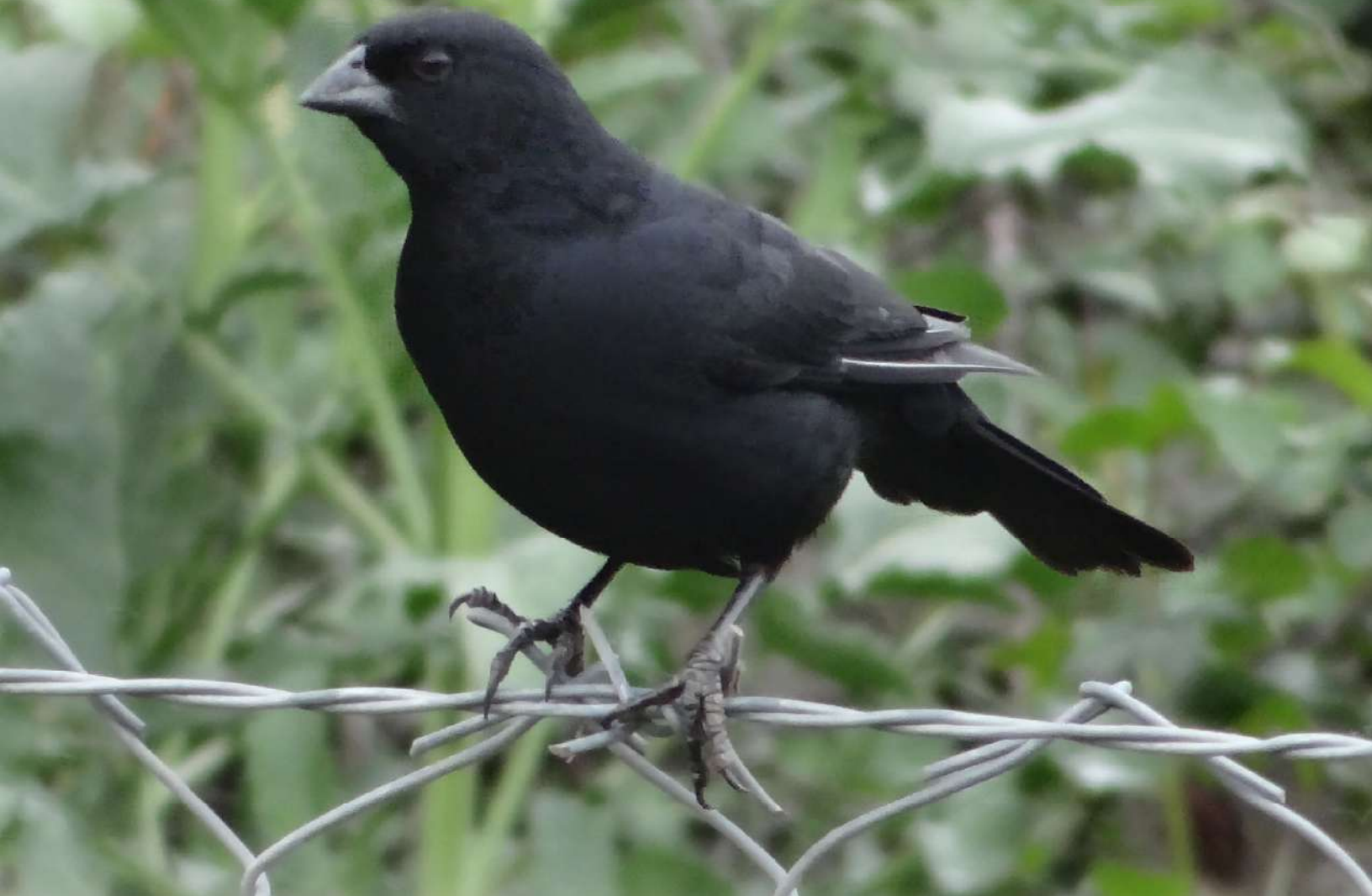
Arriba Izq.: Mirlo de pico corto ( Molothrus rufoaxillaris ), 31 de octubre 2013, Agua Buena (Reg. VI), foto Rodrigo Barros.

río El Volcán (Reg. Metr.) el 02.10 (J.P. Gabella, P. Vial); nuevamente se reportan varios avistamientos de Tenca de alas blancas ( Mimus triurus ), con 1 ej. en San Pedro de Atacama (Reg. II) el 22.09 y 21.10 (F. de Groot), 1 ej. en el Parque Juan López, Antofagasta (Reg. II) entre el 07.09 y 06.10 (Ch. Moreno, A. Silva), 1 ej. en Punta de Choros (Reg. IV) el 07.10 (D. Reyes), 1 ej. en la Panamericana Norte, sector Canela (Reg. IV) el 23.01 (D. Martínez), 1 ej. en Algarrobo (Reg. V) entre el 18 y 21.09 (R. Barros, V. Maturana, C. Moya), 1 ej. en el colegio Craighouse (Reg. Metr.) el 14.01 (R. González P.), y 1 ej. en las vegas cerca-