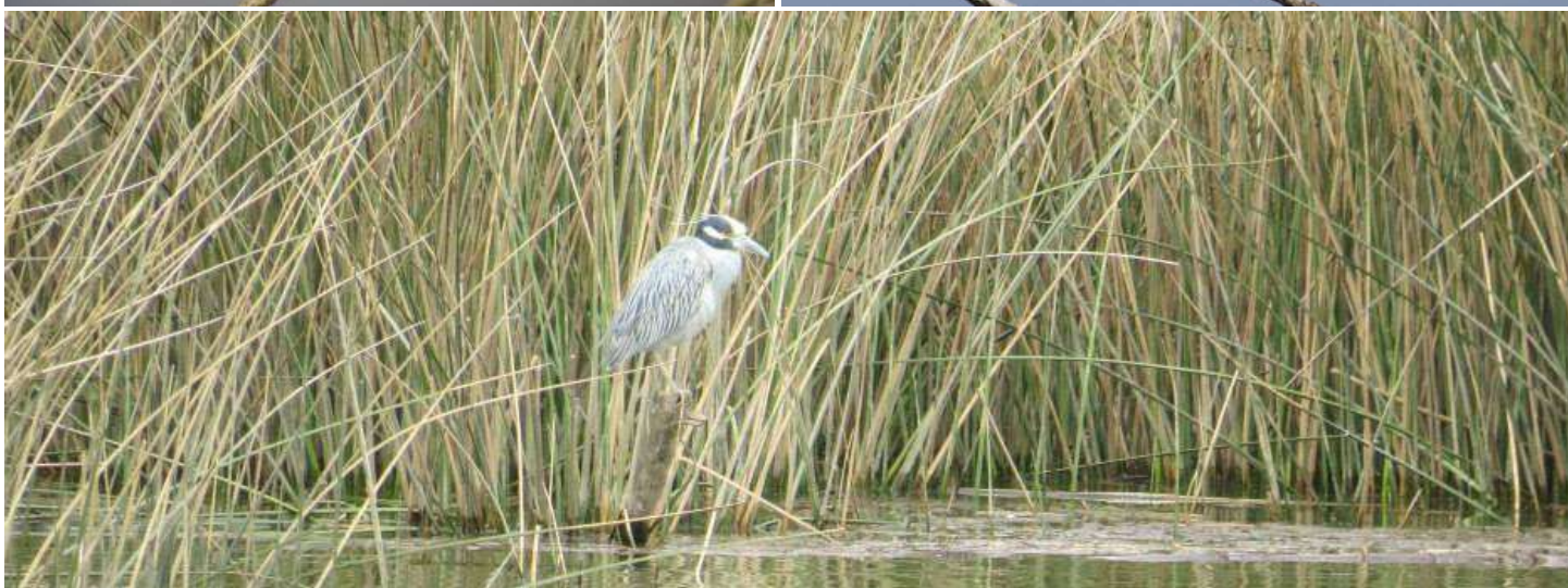
Arriba Izq.: Pelicano pardo ( Pelecanus occidentalis ), 16 de febrero 2014, Antofagasta (Reg. II); Arriba Der.: Pelicano pardo ( Pelecanus occidentalis ), 23 de noviembre 2013, caleta de Coquimbo (Reg. IV); Centro Izq.: Huairavo de corona amarilla ( Nyctanassa violacea ), 24 de octubre 2013, puerto de Arica (Reg. XV); Centro Der.: Huairavo de corona amarilla ( Nyctanassa violacea ), 10 de diciembre 2013, puerto de Arica (Reg. XV); Abajo: Huairavo de corona amarilla ( Nyctanassa violacea ), 19 de septiembre 2013, Llico (Reg. VII).