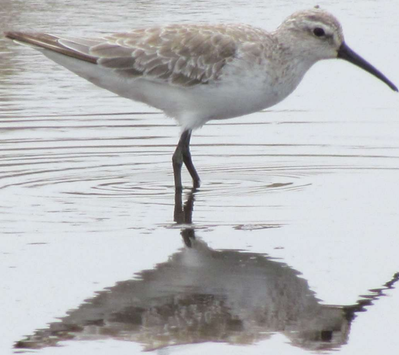
Playero zarapito ( Calidris ferruginea ), 07 de noviembre 2013, desembocadura del río Lluta (Reg. XV), foto Ronny Peredo.