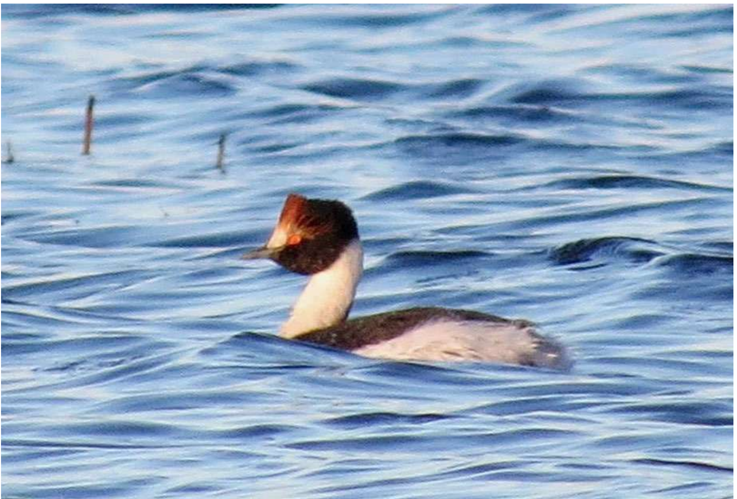
Pimpollo tobiano ( Podiceps gallardoi ), 12 de octubre 2013, laguna Inia Kampenaike (Reg. XII) , foto Humberto Gómez.

Los avistamientos raros para los cuales no recibimos "prueba" (foto, grabación de sonido, etc.) son señalados con un *.