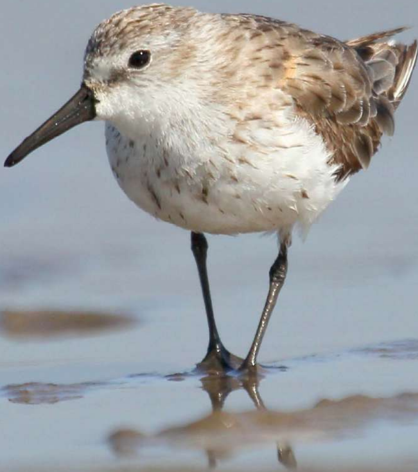
Playero occidental ( Calidris mauri ), 26 de octubre 2013, desembocadura del río Maipo, foto Ignacio Azócar